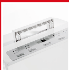
Pannello di controllo e maniglia per il trasporto Control panel and carry handle

The precise lines characterize its minimal design and the sharp shape facilitates its positioning in the room. Ecological, compact and performing, it is suitable for all seasons and performs its dehumidifier function with precision, making the air healthier.