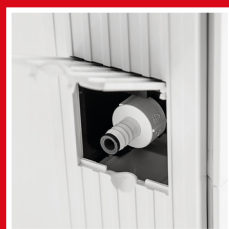
Attacco per drenaggio condensa continuo Fitting for continuous condensate drainage