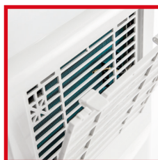
Filtro dell'aria sull'aspirazione, rimovibile per la pulizia Air filter on the air inlet, removable for cleaning