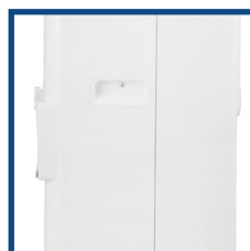
Pratiche maniglie laterali Useful side handles