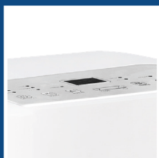
Pannello comandi digitale con display a LED Digital control panel with LED display

Ideal for small to medium size environments, ARGO KENNY EVO is light and easy to handle. The multifunction display and remote control are extremely easy to use.