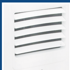
Alette regolabili in senso verticale Vertically adjustable flaps