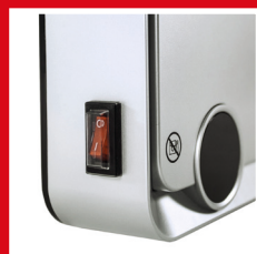
Tasto accensione/ spegnimento On/off button