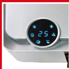
Display digitale tondo, LED blu Digital rounded display, blue LED