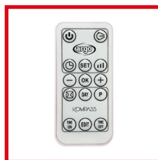
Telecomando slim a infrarossi Slim infrared remote control