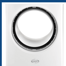
Ventilatore senza pale Bladeless fan