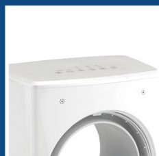
Pannello di controllo digitale e display a LED Digital control panel and LED display

Minimal aesthetics and handling facilitated by light weight, the innovative bladeless system allows it to perform its functions in complete safety and silence. Compact and handy, it can also be placed outdoors.