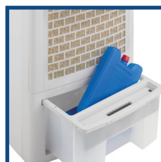
Filtro antipolvere e pannello evaporativo a nido d'ape, tanica 6 L Anti-dust and evaporative honeycomb filters, tank 6 L