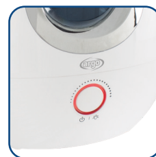
Manopola retroilluminata multifunzione Backlit multifunctional knob