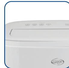
Flap motorizzato Motorized flap