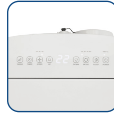
Pannello comandi touch con display a LED Touch control panel with LED display