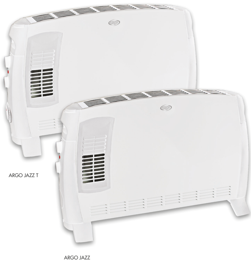
ARGO JAZZ T