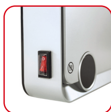
Tasto accensione/ spegnimento On/off button