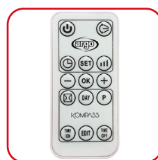
Telecomando slim a infrarossi Slim infrared remote control