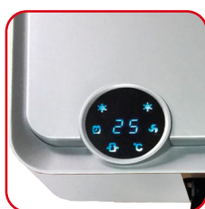
Display digitale tondo, LED blu Digital rounded display, blue LED

It fits perfectly on the wall, not only for its excellent performance as a fan heater, but also for its refined elegance that makes it a true furnishing complement totally compatible with contemporary spaces.