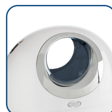
Design accattivante e cura dei dettagli Appealing design and attention to details