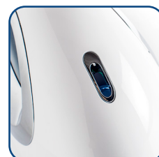
Uscita vapore Mist outlet