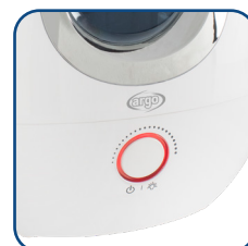
Manopola retroilluminata multifunzione Backlit multifunctional knob