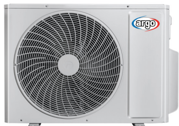
ARGO DUAL 18 DCI R32 ARGO TRIAL 21 DCI R32 ARGO TRIAL 24 DCI R32 ARGO QUADRI 28 DCI R32