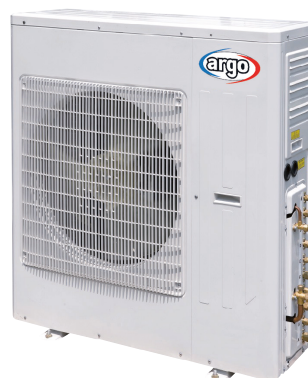
X3MI ECO 105SH X3MI ECO 120SH

Possibilità di scelta tra diverse capacità e tipi di unità interne.