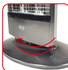
Ampio raggio di oscillazione (70°) Wide range of oscillation (70°)