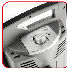
Pannello comandi e pratica maniglia per il trasporto Control panel and practical carrying handle