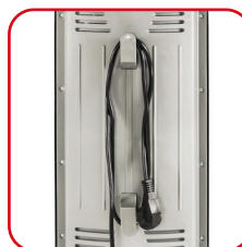
Comodo avvolgicavo Practical cord-winding hook