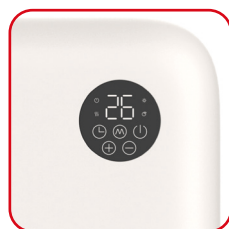
Display a LED con tasti soft touch LED display with soft touch keys

Compactness and total cleanliness of the shape. Installed on the wall becomes one with it. The pure white of the matt effect surface is interrupted by the circular display that allows you to keep under control all the features of the product. Perfect for the bathroom, thanks to the IP22 protection, ideal for contemporary environments.