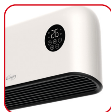
Potente flusso d'aria ottimizzato verso il basso Powerful optimized downward flow of air