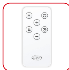
Telecomando slim multifunzione Slim multifunction remote control