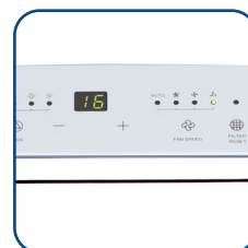
Pannello comandi digitale con display a LED Digital control panel with LED display