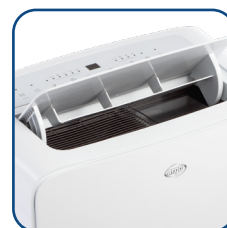
Flap motorizzato Motorized flap