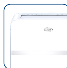
Cura dei dettagli Attention to details