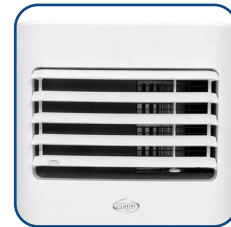
Alette regolabili in senso verticale Vertically adjustable flaps