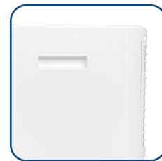
Pratiche maniglie laterali Useful side handles