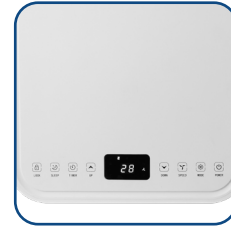
Pannello comandi touch con display a LED Touch control panel with LED display