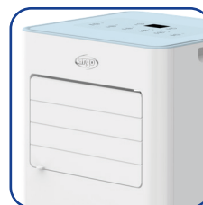
Alette regolabili manualmente Manually adjustable flaps