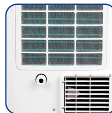
Filtro dell'aria lavabile facilmente rimovibile Washable air filter easily removable