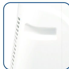
Pratiche maniglie laterali Practical side handles