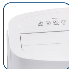
Flap motorizzato Motorized flap