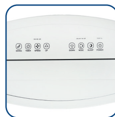
Pannello comandi touch con display a LED Touch control panel with LED display