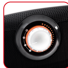
Manopola comandi Control knob