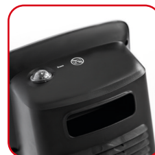
Maniglia e tasto di oscillazione con protezione per l'acqua Handle and swivel button with water protection