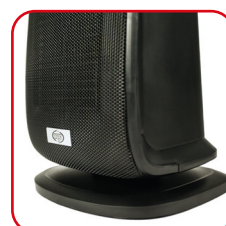
Base oscillante Swinging base