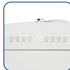
Pannello comandi touch con display a LED Touch control panel with LED display