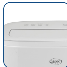
Flap motorizzato Motorized flap