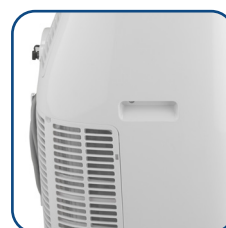
Pratiche maniglie laterali Practical side handles