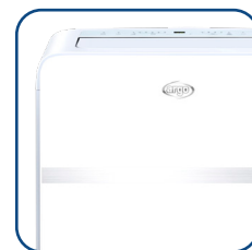
Cura dei dettagli Attention to details