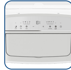
Pannello comandi digitale con display a LED Digital control panel with LED display