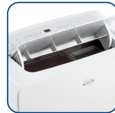
Flap motorizzato con posizione fissa o oscillazione automatica Motorized flap with fixed position or automatic swinging