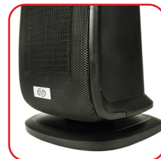
Schwenksattel Swinging base