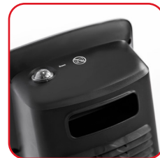
Griff und Schwenktaste mit Wasserschutz Handle and swivel button with water protection