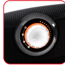
Bedienknopf Control knob