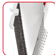
ARGO BOOGIE PLUS

Filtro di purificazione dell'aria, facilmente rimovibile per la pulizia Air purification filter, easy to remove for cleaning (BOOGIE PLUS)