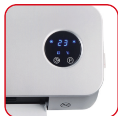
Display digitale tondo con LED blu Original rounded display with blue LED

Perfect for the bathroom, it must be mounted on the wall and is controllable by the infrared slim remote controller. The weekly timer allows for personalized day-by-day programming. The ECO-SMART function adjusts the capacity intelligently and the open window sensor avoids unnecessary waste. Its enveloping lines and minimal aesthetics go well with the matt silver finish of the body.