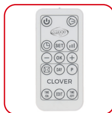
Telecomando slim multifunzione Slim multifunction remote control