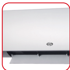
Oscillazione automatica flap Automatic swing of the flap