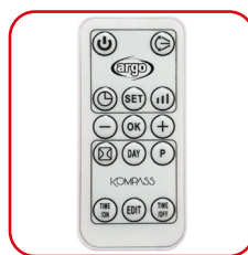
Telecomando slim a infrarossi Slim infrared remote control