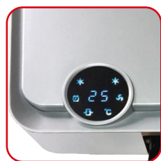
Display digitale tondo, LED blu Digital rounded display, blue LED

It fits perfectly on the wall, not only for its excellent performance as a fan heater, but also for its refined elegance that makes it a true furnishing complement totally compatible with contemporary spaces.