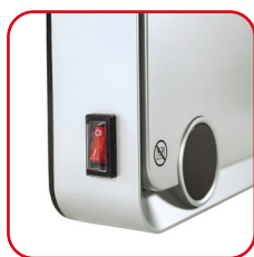
Tasto accensione/spengimento On/off button