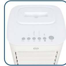
Pannello di controllo con LED di funzionamento Control panel with operation LEDs