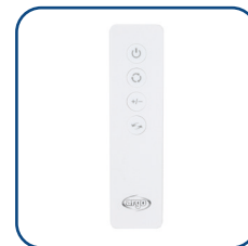
Telecomando a infrarossi Infrared remote control