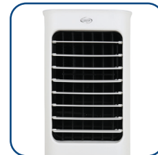
Oscillazione automatica verticale e regolazione orizzontale manuale delle alette Automatic vertical swinging and manual horizontal adjustment of flaps