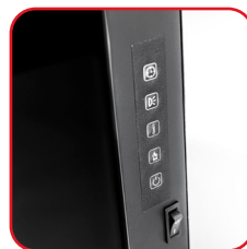
Seitliches Bedienfeld Side control panel