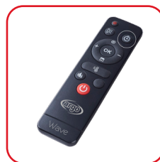
Infrarot- Fernbedienung Infrared remote control