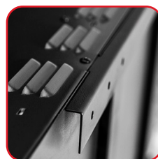
Wandhalterungen mitgeliefert Brackets for wall mounting provided