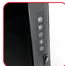
Pannello di controllo laterale Side control panel