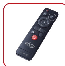
Telecomando a infrarossi Infrared remote control