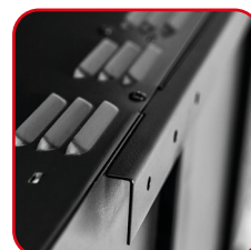
Supporti per appensione a parete forniti Brackets for wall mounting provided