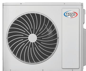
ARGO QUADRI 36 DCI R32 ARGO PENTA 42 DCI R32

Possibilité de choix parmi différents types d'unités intérieures et de nombreuses combinaisons de puissance.