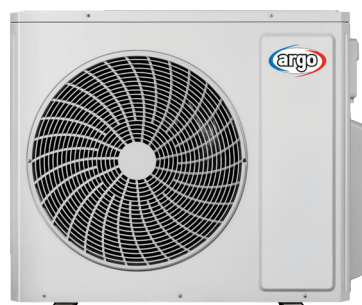
ARGO QUADRI 36 DCI R32 ARGO PENTA 42 DCI R32

Possibilità di scelta tra diversi tipi di unità interne e molti abbinamenti di capacità.